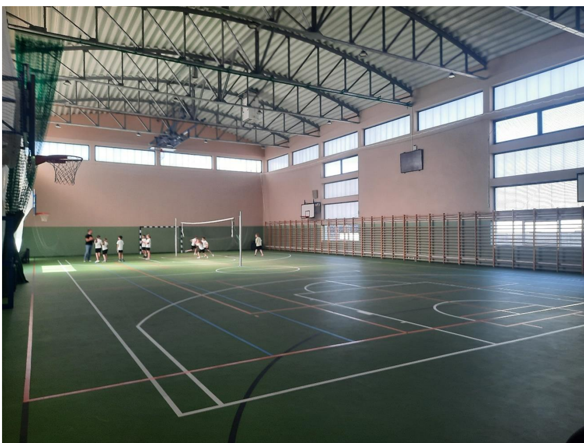
Zdjęcie 21. Hala sportowa