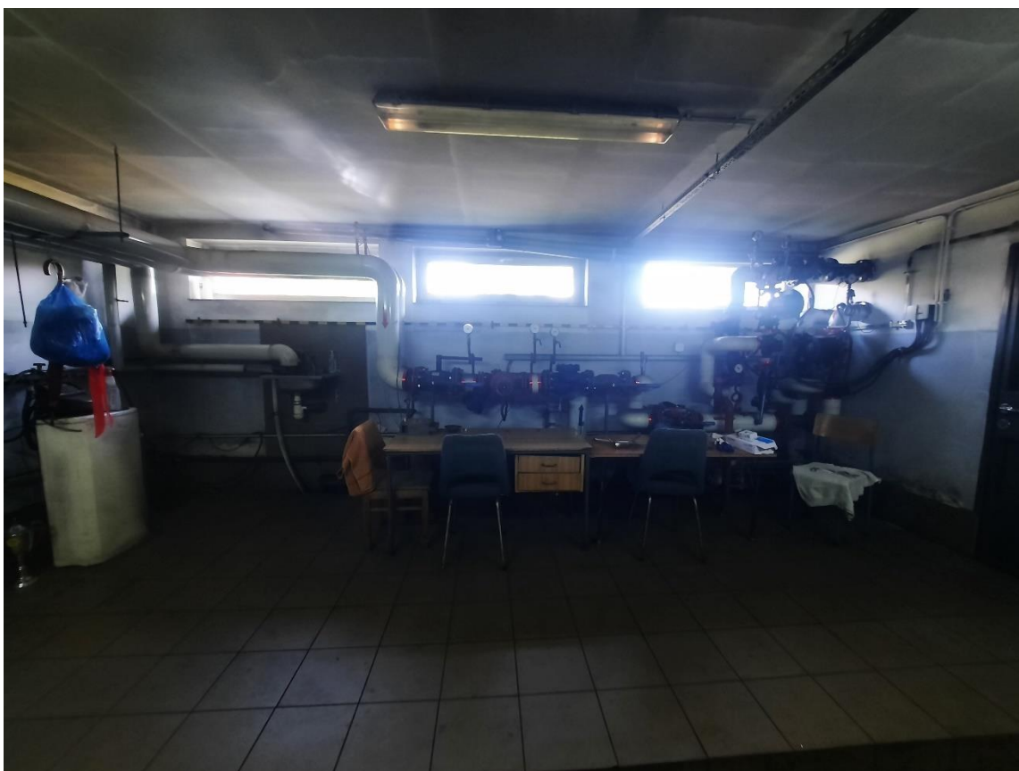
Zdjęcie 19. Kotłownia 3 - węzeł