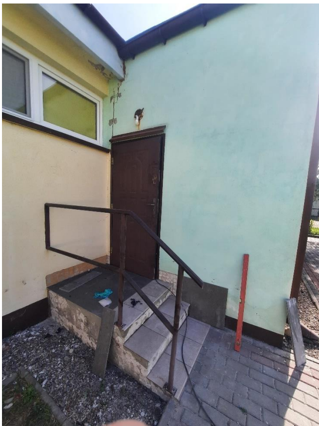
Zdjęcie 4. Elewacja zachodnia