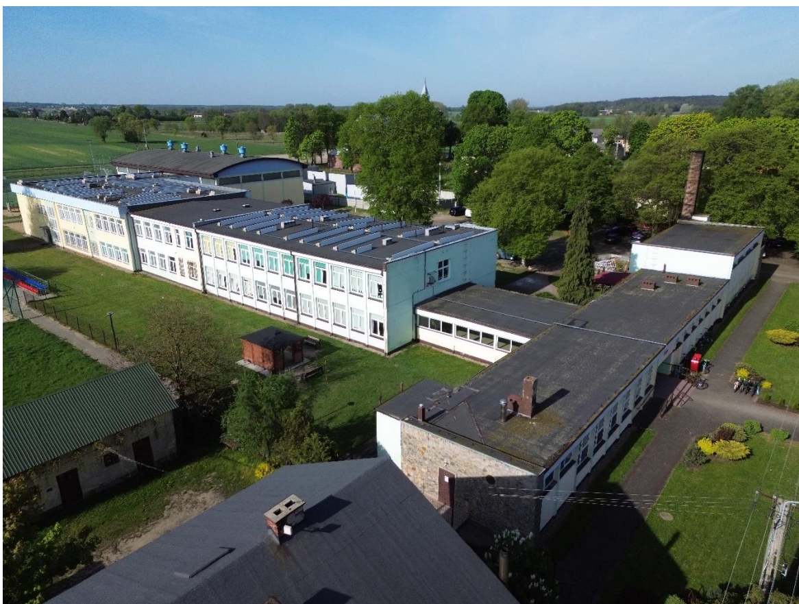
Zdjęcie 2. Elewacja północno zachodnia