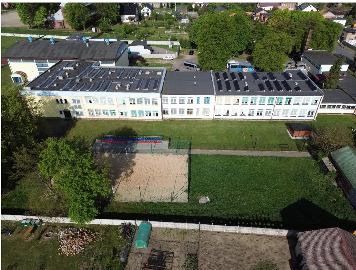
Zdjęcie 5. Elewacja wschodnia