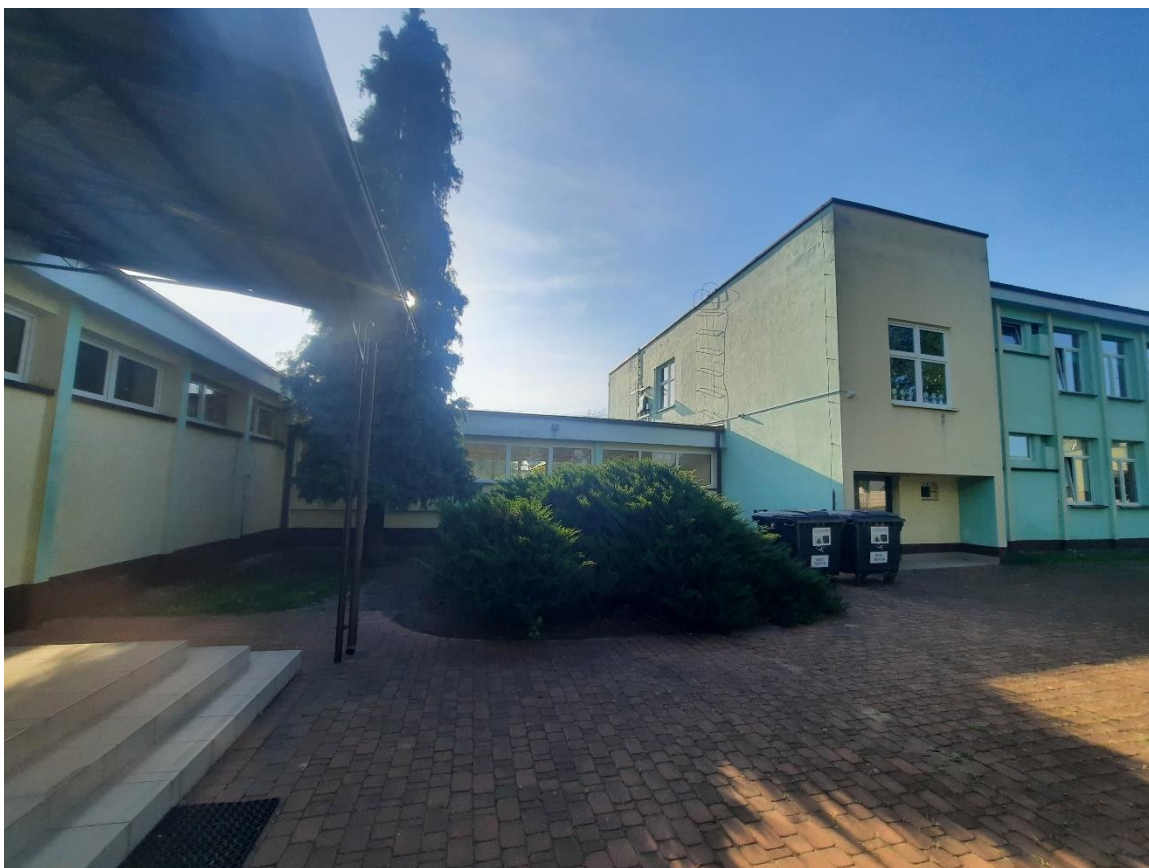
Zdjęcie 11. Elewacja zachodnia