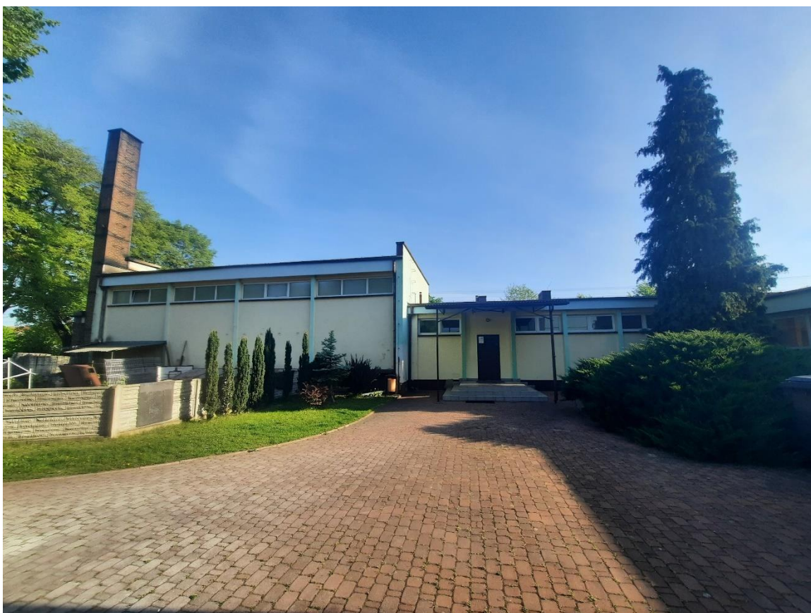
Zdjęcie 12. Elewacja południowa