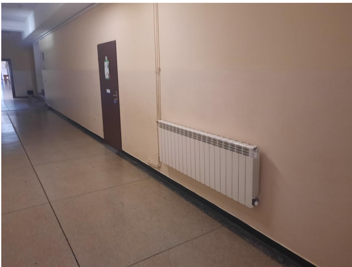
Zdjęcie 23. System ogrzewania 2