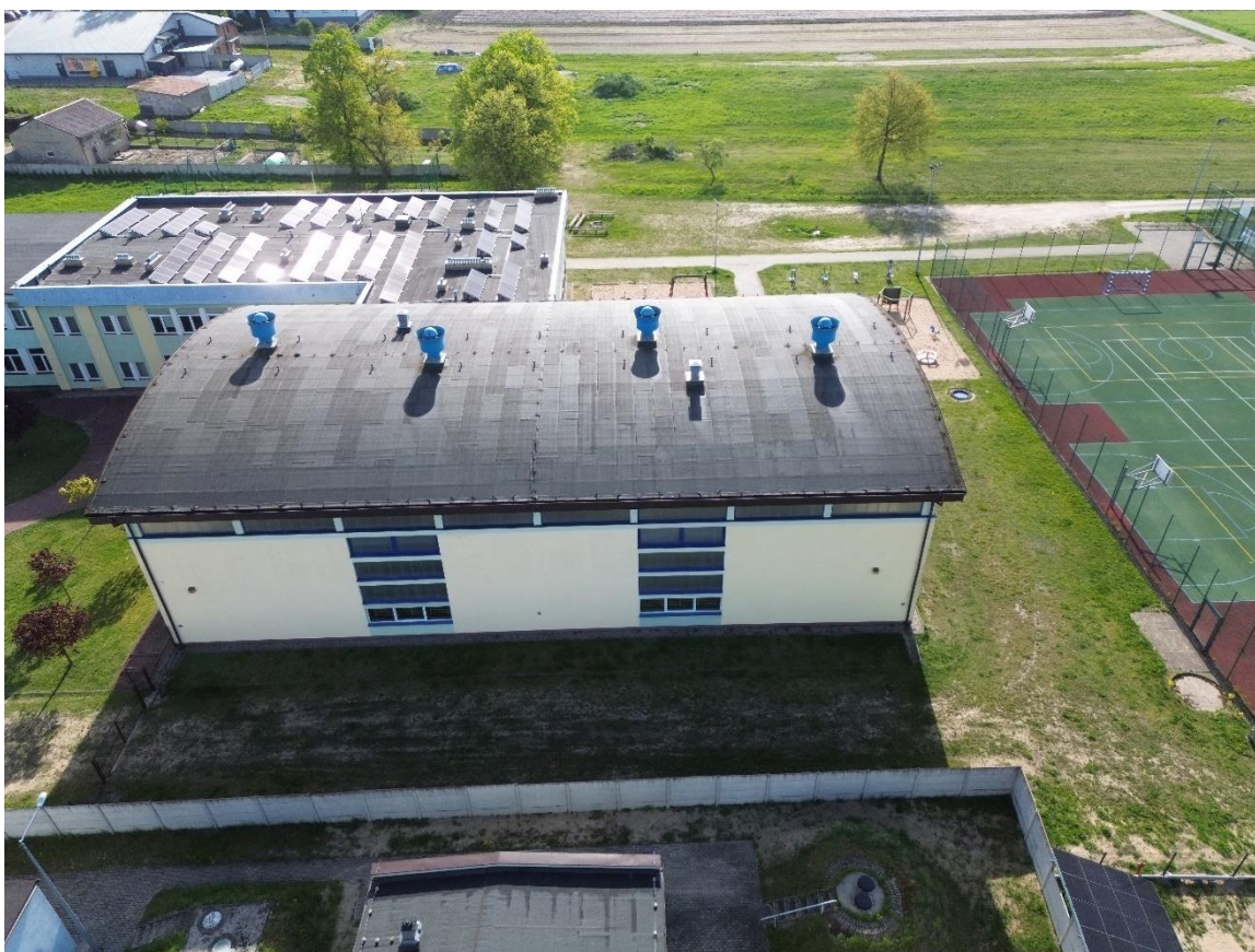
Zdjęcie 8. Elewacja zachodnia