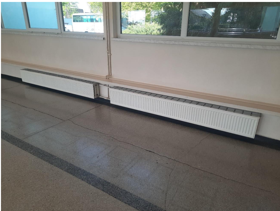
Zdjęcie 22. System ogrzewania 1