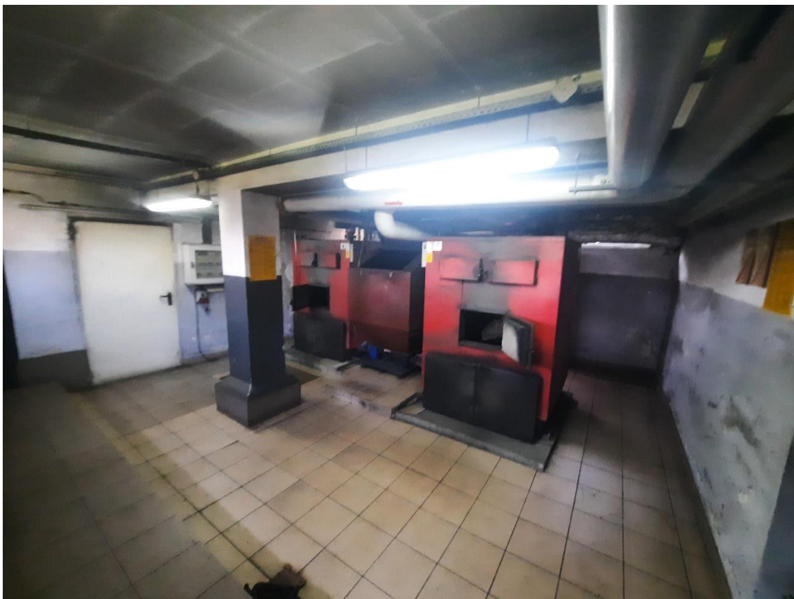
Zdjęcie 17. Kotłownia 1