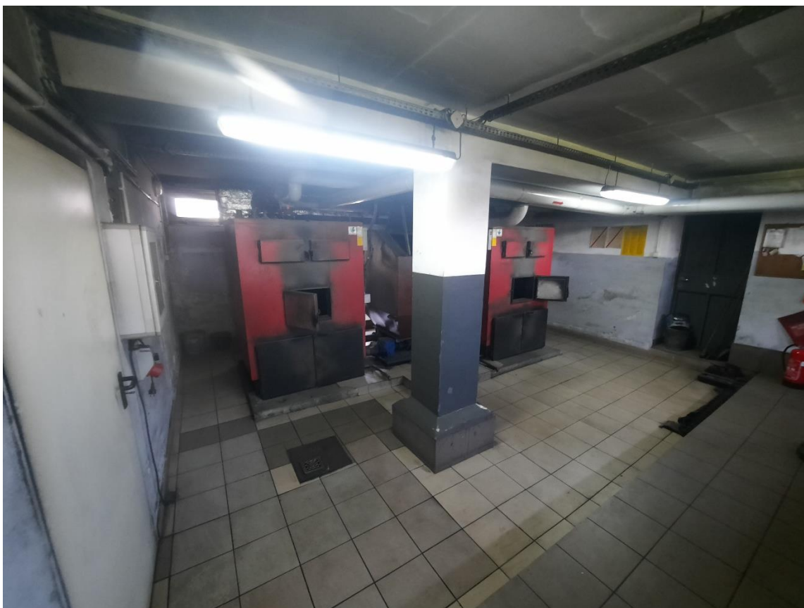
Zdjęcie 18. Kotłownia 2