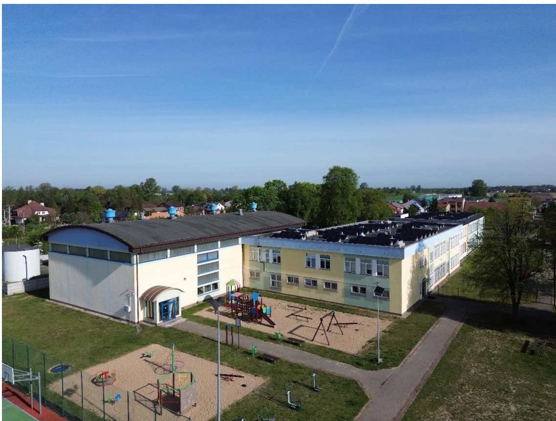
Zdjęcie 6. Elewacja południowo wschodnia