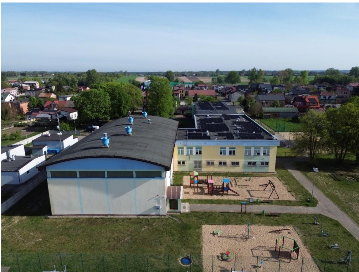
Zdjęcie 7. Elewacja południowa