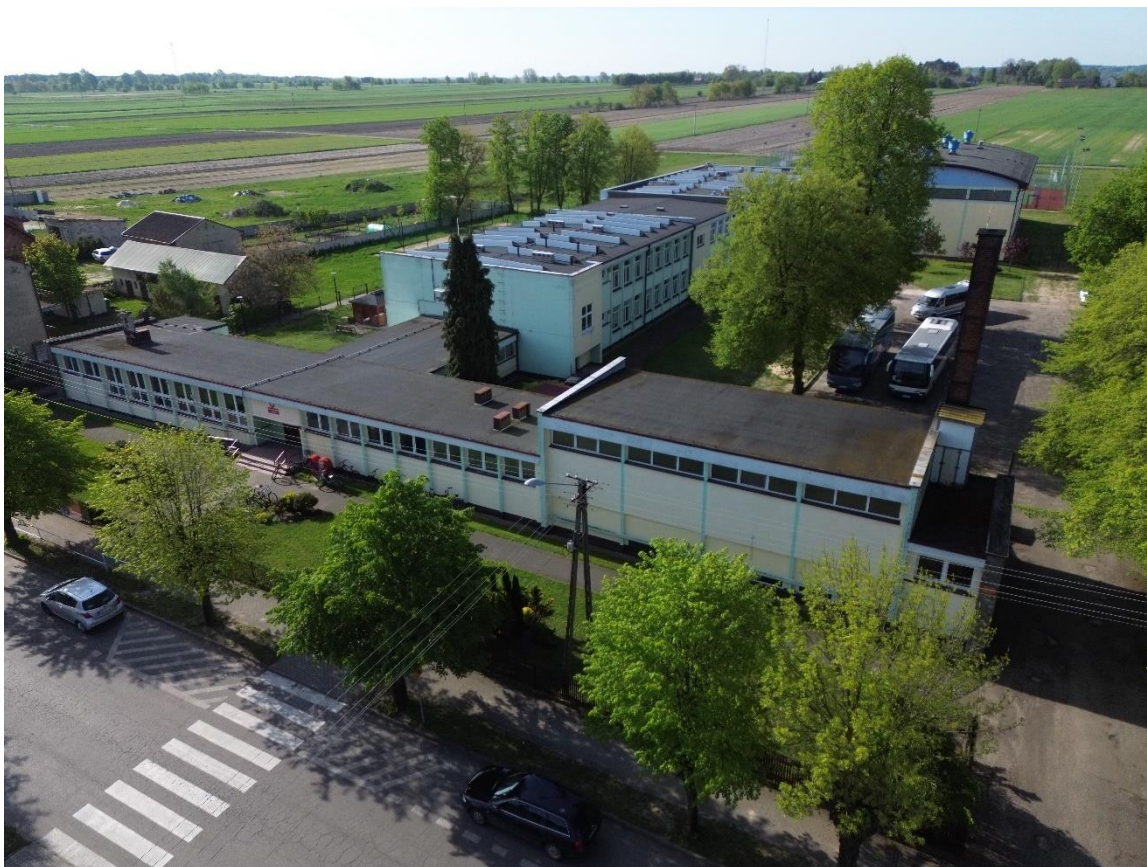
Zdjęcie 14. Elewacja północno zachodnia