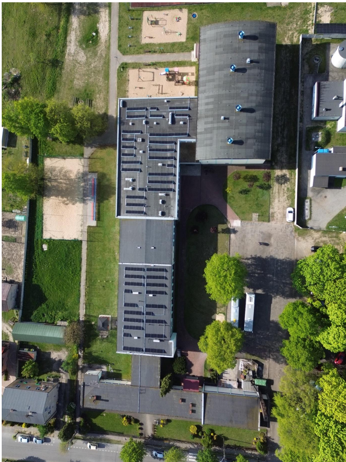
Zdjęcie 15. Rzut z góry