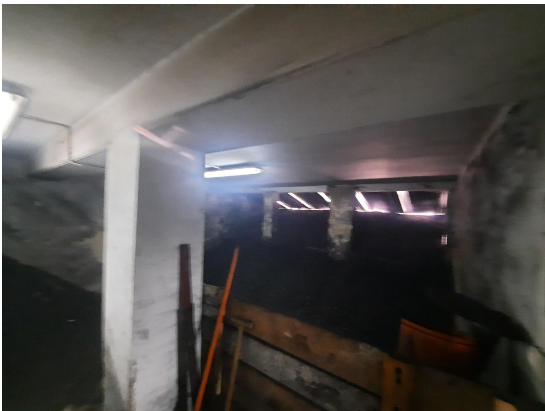
Zdjęcie 20. Skład opału