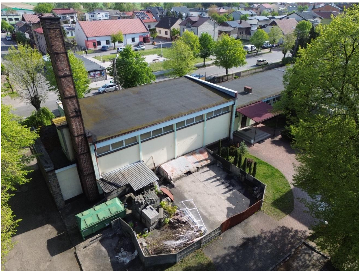
Zdjęcie 13. Elewacja południowo zachodnia