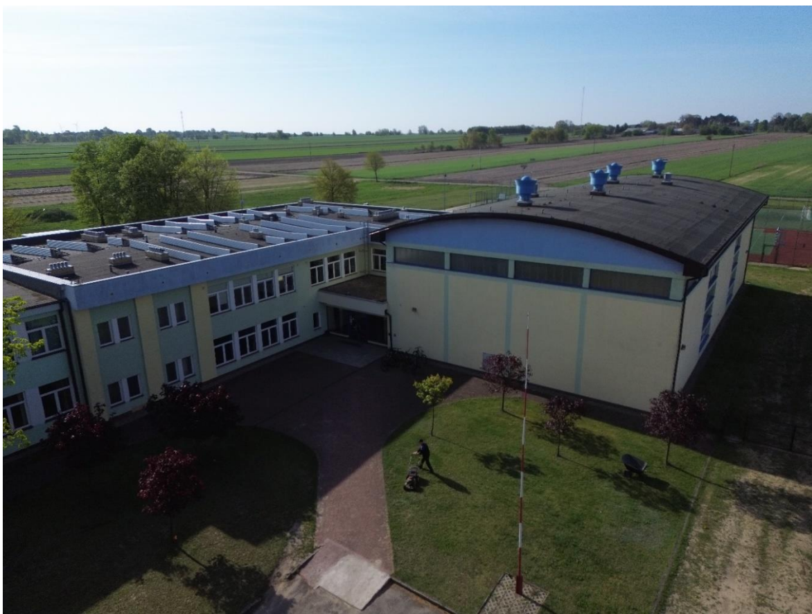
Zdjęcie 9. Elewacja północno zachodnia