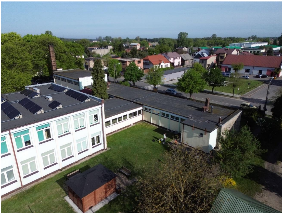
Zdjęcie 3. Elewacja południowo wschodnia