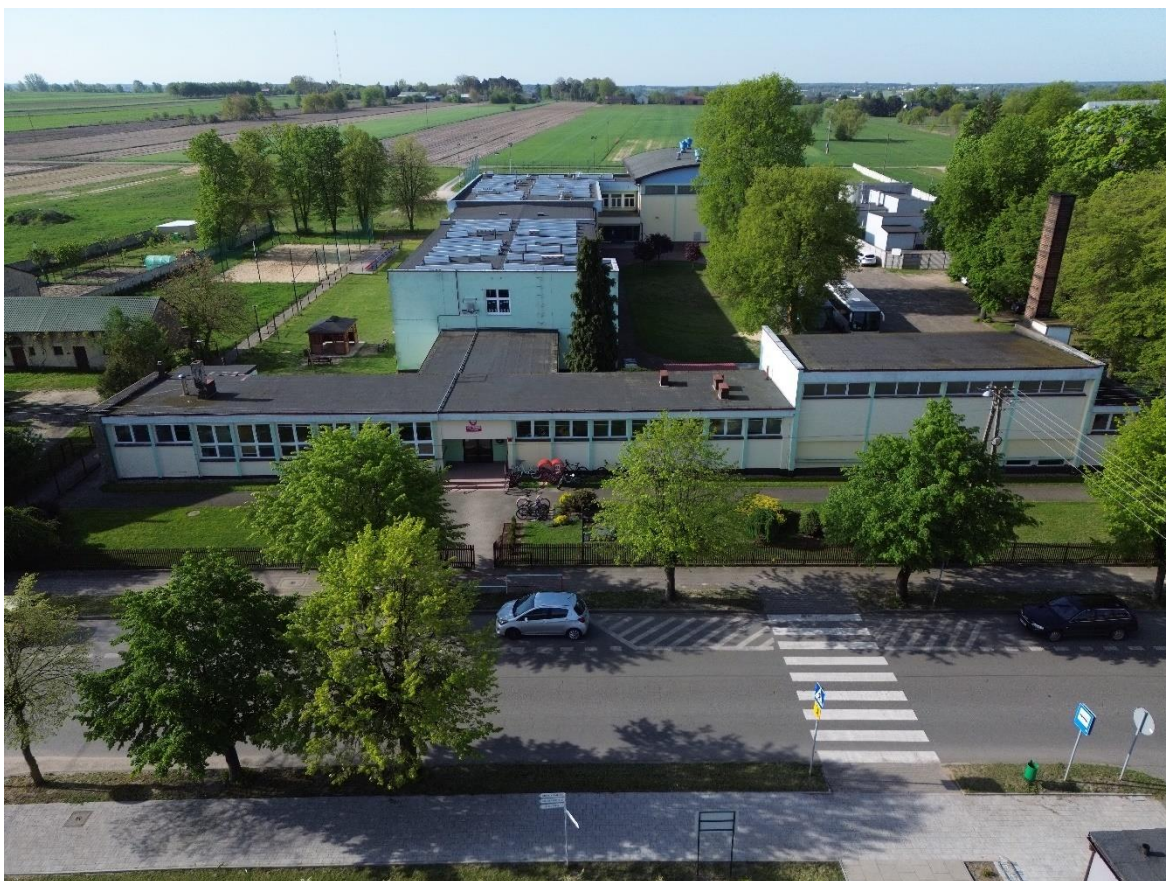
Zdjęcie 1. Elewacja północna