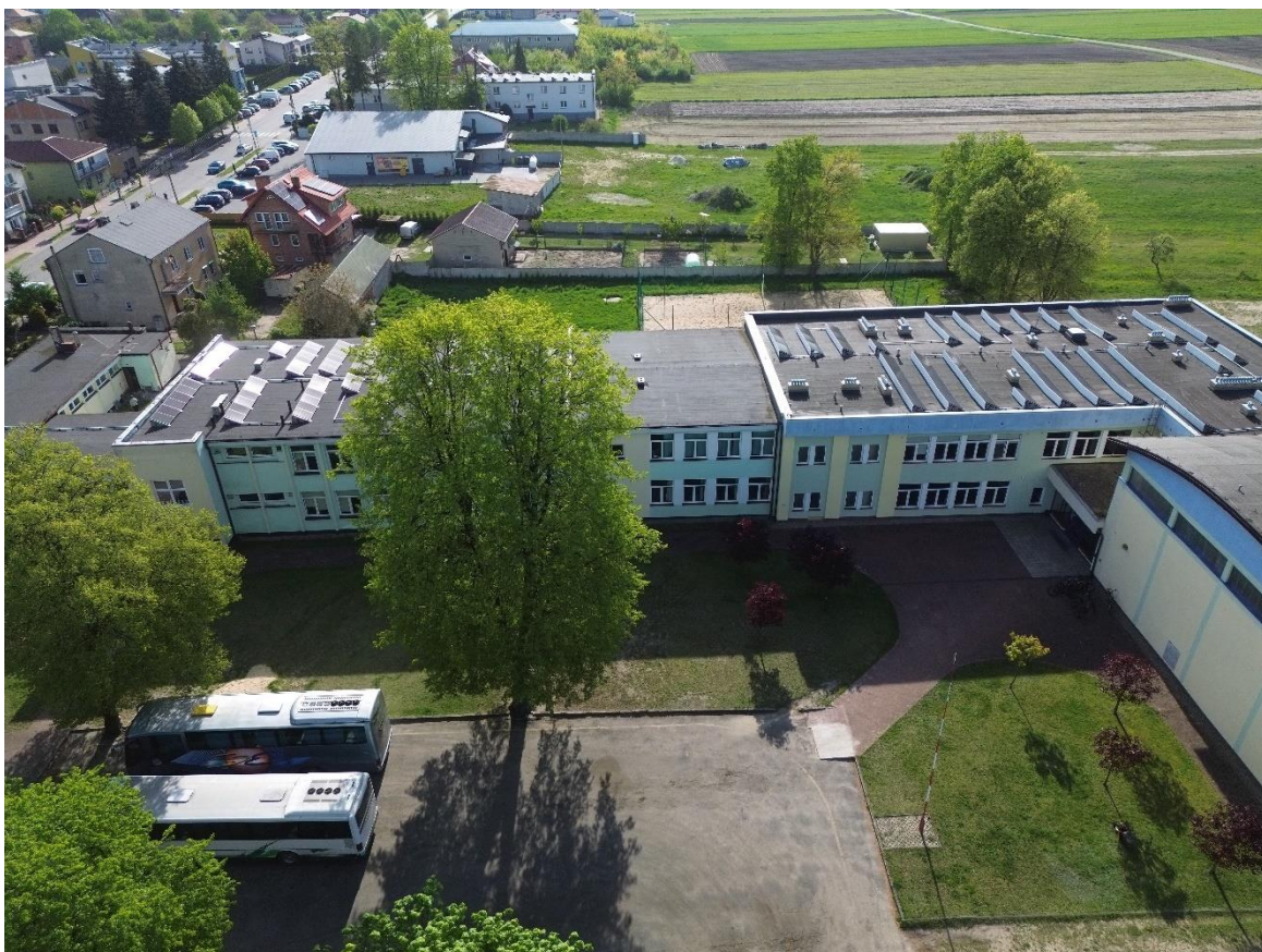
Zdjęcie 10. Elewacja zachodnia